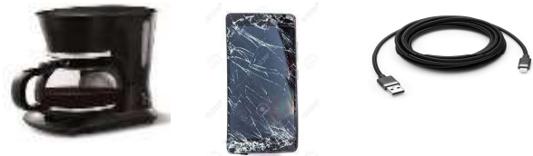
DEEE (DECHETS D'EQUIPEMENTS ELECTRIQUES ET ELECTRONIQUES)