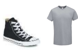
CHAUSSURES / TEXTILE