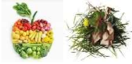
DECHETS ALIMENTAIRES / DECHETS VERTS