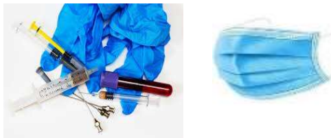
DECHETS DE SOIN / MASQUE