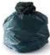
ORDURES MENAGERES ET/OU DECHETS EN SACS