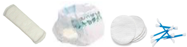
PROTECTION HYGIENIQUE / COUCHE / COTON / COTON-TIGE