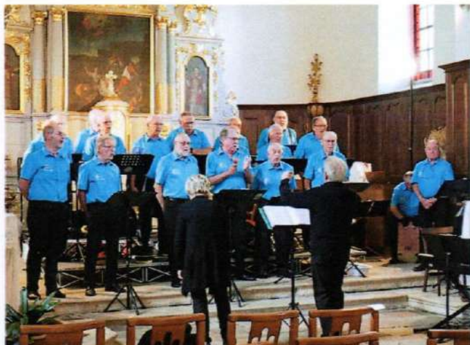
Une prestation très applaudie par un public nombreux. Suivie du pot de l'amitié à la salle polyvalente.

En avant-première de la commémoration du 16 septembre, la chorale « Chorège » (chœur d'hommes) a donné un concert à l'église de Gouhenans, le 14 septembre à 16h, avec en entrée, des chants patriotiques.