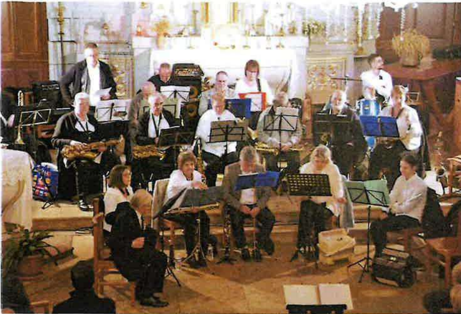
Harmonie de Belverne