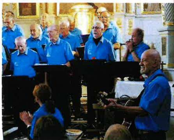
Chorège de Valdoie